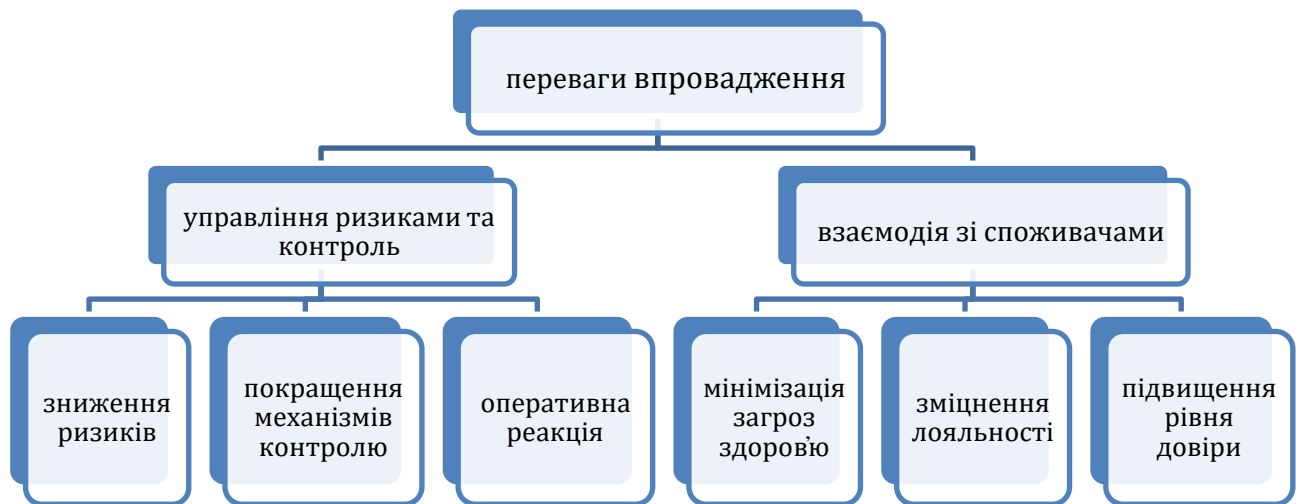
Рисунок 2. Переваги впровадження систем безпеки, що реалізуються в закладі харчування «Геремок».