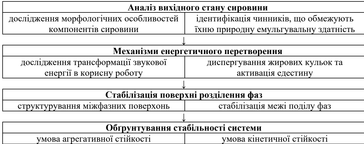
Рисунок 1. Блок-схема узагальненої фізичної моделі конопляної емульсії

макронутрієнти насіння конопель представлені просторово ізольованими структурами. Основна частина ліпідів зосереджена в сім'ядолях у формі олеосом, оточених фосфоліпідною мембраною з білками-олеозинами. Білкові речовини, представлені переважно едестином, які локалізовані у протеїнових тілах. Клітинні стінки, що складаються з целюлози, геміцелюлози та пектину, забезпечують структурну цілісність макроелементів у їхньому нативному стані.